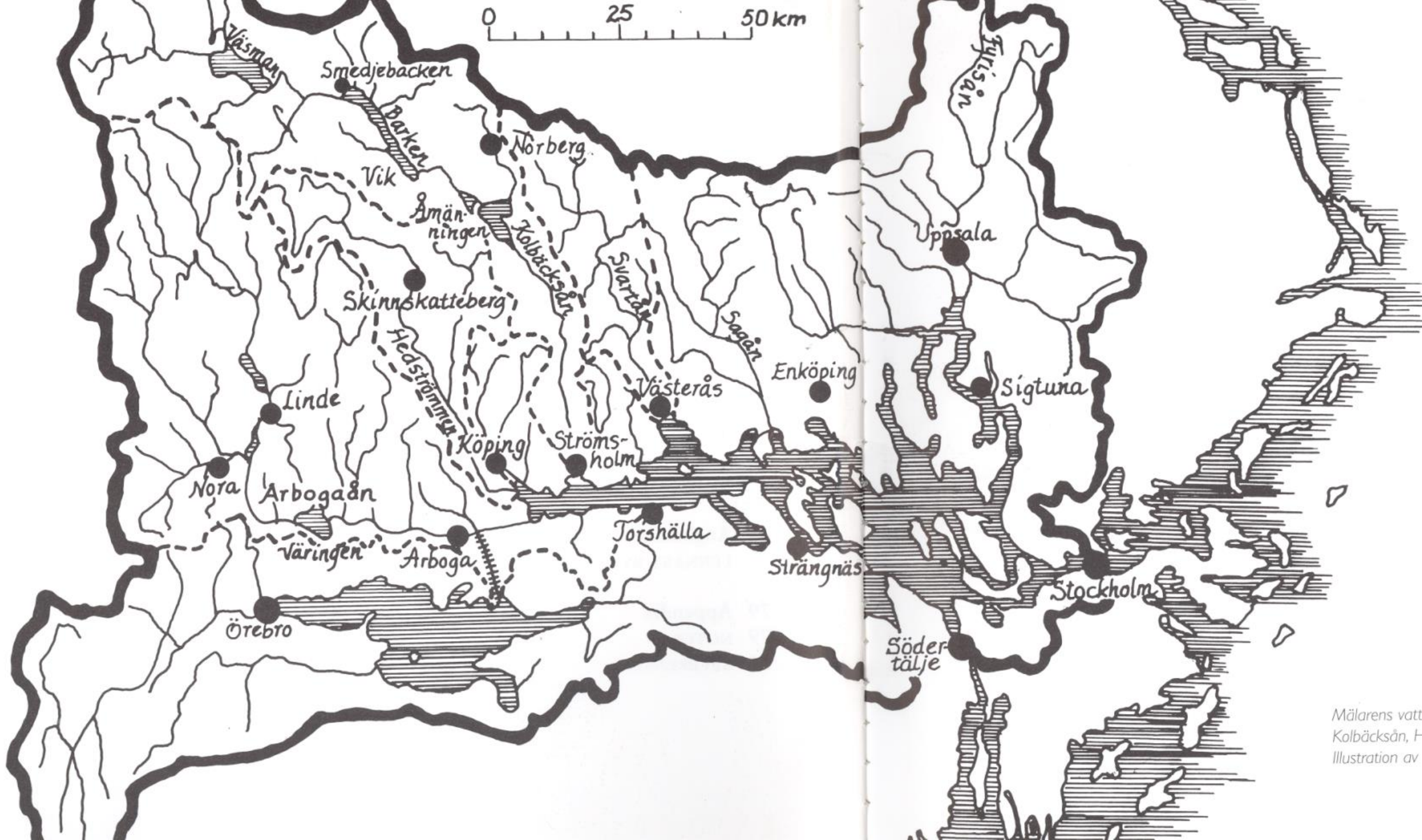
Mälarens vatt Kolbäcksån, H Illustration av