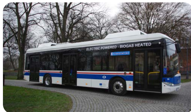
Biogasuppvärmd elbuss i Västerås.