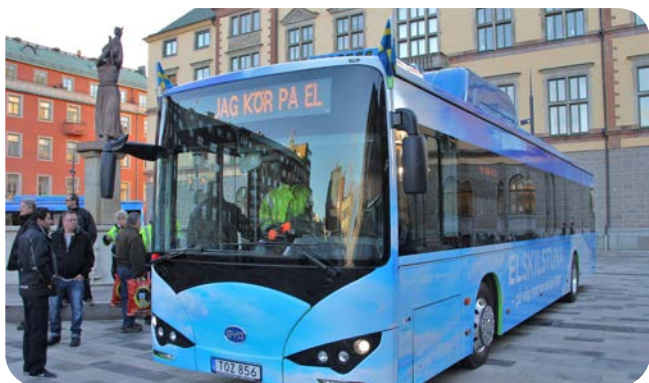
Elbuss från Eskilstuna.

Allt fler elbussar används för en tyst och lokalt utsläppsfri stadsbusstrafik. Kontakta oss gärna på info@biodrivost.se för mer information om elbussar och laddning av dessa.