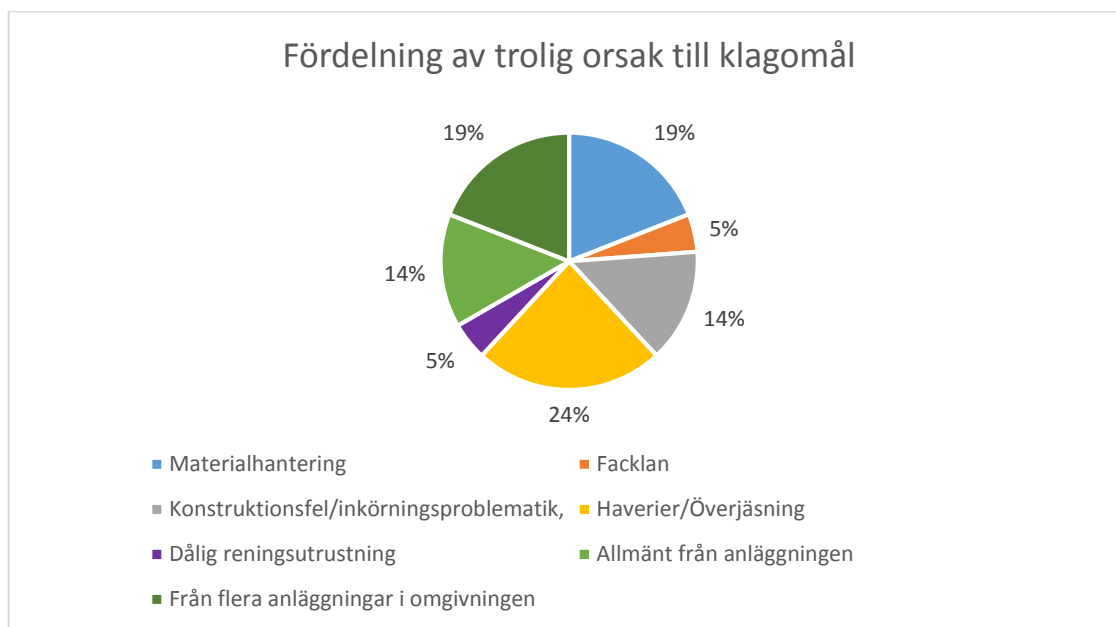
Figur 3. Fördelning av trolig orsak till inkomna luktklagomål från undersökta anläggningar enligt uppgifter under januari – maj 2014.

En annan betydande orsak är materialhanteringen, vilket omfattar exempelvis öppen hantering av rötresten eller vid lastning och lossning. Andra orsaker till luktklagomål är även att anläggningarna haft inkörningsproblem och konstruktionsfel. Klagomålen har då oftast inkommit redan vid start och verksamheten har orsakat luktproblem innan driften är helt igångkörd. Andra orsaker som förekommit har också varit när gasen har facklats av. Däremot anges oftast att orsakerna är en kombination av flera och det är svårt att ange exakt vad som orsakar luktförekomsten. I Figur 3 visas en fördelning av de troliga orsakerna till luktklagomål som är inrapporterade till myndigheterna.